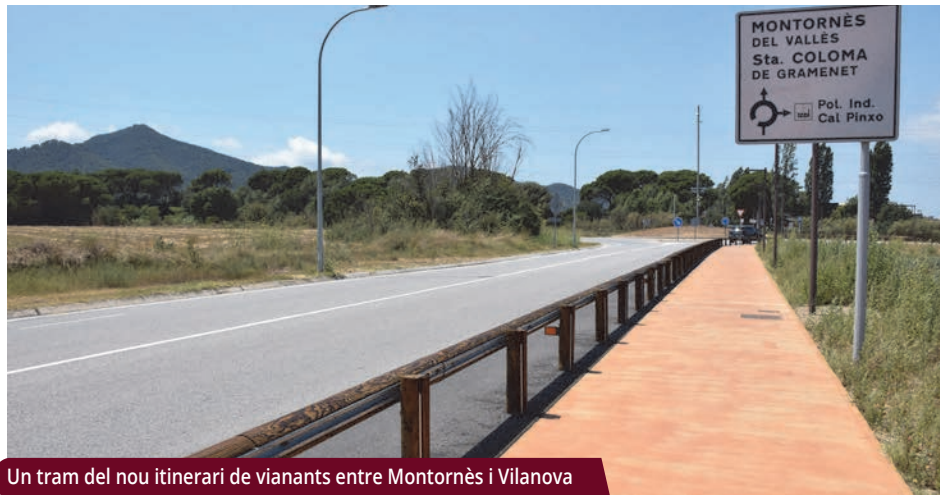
Un tram del nou itinerari de vianants entre Montornès i Vilanova

L'itinerari comprèn el tram entre el carrer de les Moreres (al barri Ametller de Montornès) i la rotonda d'accés a l'entramat urbà de Vilanova del Vallès. —