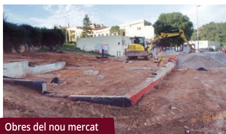
Obres del nou mercat

Un cop acabat, l'Ajuntament gestionarà el mercat de manera directa i farà l'atorgament de les 10 parades disponibles i del bar a través de concessions públiques. L'espai està pensat per a parades d'alimentació, tot i que també hi podran optar altres.