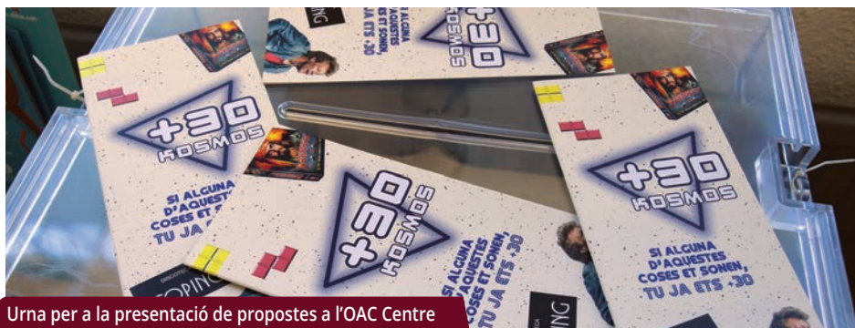
Urna per a la presentació de propostes a l'OAC Centre

Del 7 al 9 de novembre se celebrarà la 7a Fira de l'Economia Social i Solidària. Estarà dedicada a la gestió de l'aigua, ara que fa 10 anys que el Consistori gestiona el servei de manera directa i en un moment de manca de recursos hídrics a Catalunya. Durant la fira es duran a terme conferències, una exposició i una visita guiada a la depuradora i a l'Urban River Lab. |