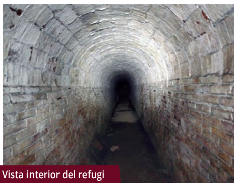
Vista interior del refugi