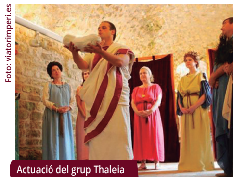
Actuació del grup Thaleia

El cap de setmana del 12 i 13 d'octu- bre s'han programat activitats gratuïtes per donar a conèixer el patrimoni local en el marc de les Jornades Europees de Patrimoni 2024.