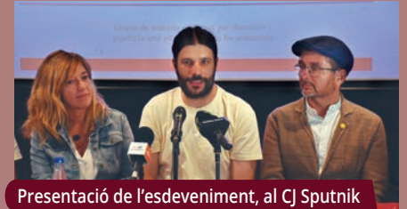
Presentació de l'esdeveniment, al CJ Sputnik

Montornès és un dels set municipis de la comarca que participen en el programa "Tardor de l'Economia Social i Solidària", que impulsa l'Ateneu Cooperatiu del Vallès Oriental.