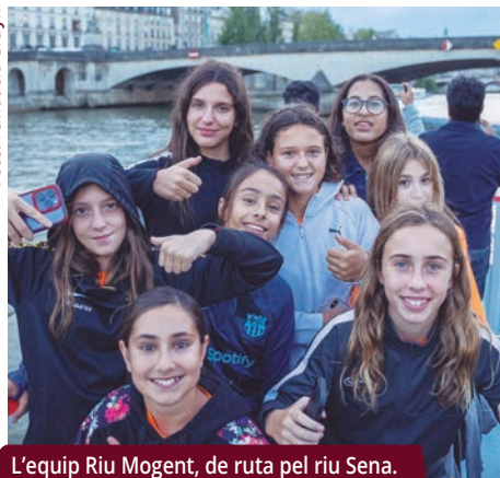
L'equip Riu Mogent, de ruta pel riu Sena.

Les esportistes montornesenques van tornar de la final europea del torneig "Salid y disfrutad" amb la tercera posició i el Premi al respecte, un guardó que s'atorga als equips que millor exemplifiquen els valors del joc net i l'esportivitat.