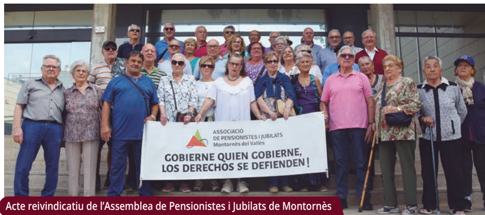
Acte reivindicatiu de l'Assemblea de Pensionistes i Jubilats de Montornès

La programació, que inclou tallers, teatre, ball i xerrades, es perllongarà fins al 24 de novembre.