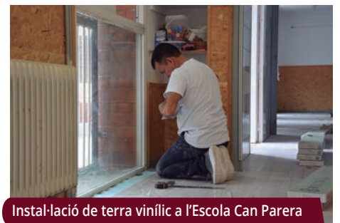
Instal·lació de terra vinílic a l'Escola Can Parera

A l'Escola d'Hoteleria del Vallès Oriental es van realitzar treballs bàsics de manteniment com ara el repintat de la zona del menjador i els seus accessos. També es va acabar d'enrajolar la sala de preparació d'aliments. La despesa ha estat de 7.500 €.