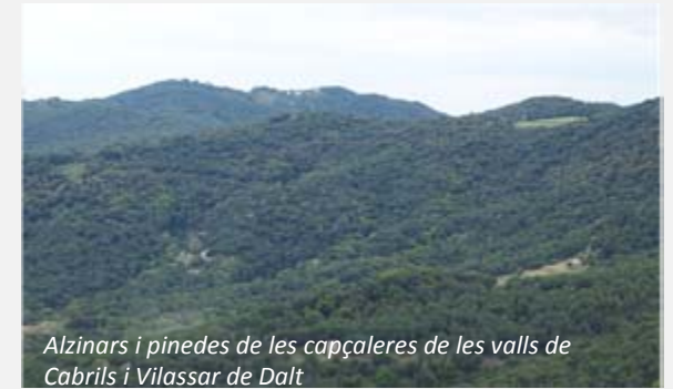
Alzinars i pinedes de les capçaleres de les valls de Cabrils i Vilassar de Dalt