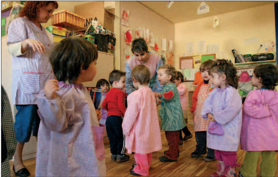
UNA AULA DE LA LLAR D'INFANTS EL LLEDONER (IMATGE D'ARXIU)

Les sessions, que s'han posat en marxa a l'octubre, van a càrrec de professionals de la formació infantil i pretenen donar eines als pares per a millorar el dia a dia amb els fills.