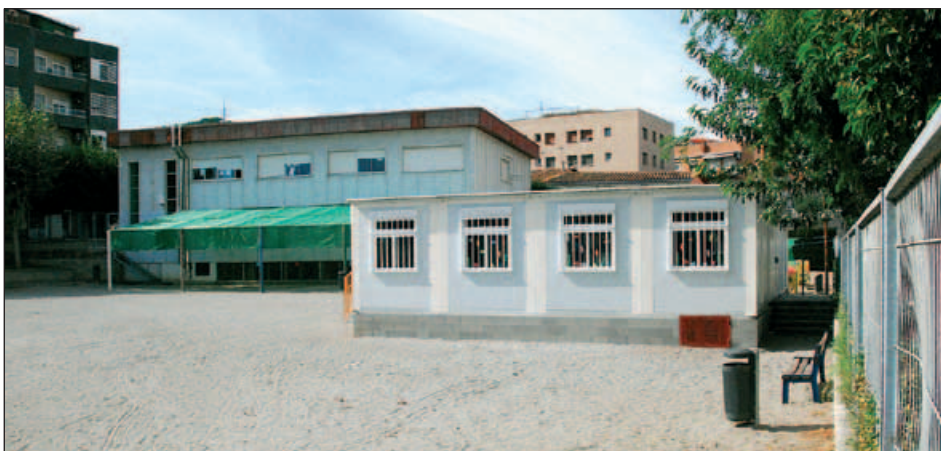
DEPENDÈNCIES DE L'ESCOLA PALAU D'AMETLLA

A banda dels ajuts directes que es concedeixen als centres i les AMPA, l'Ajuntament ha