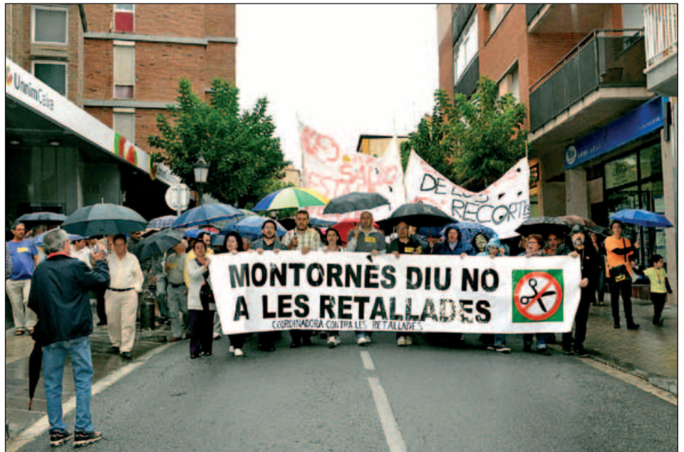
MANIFESTACIÓ DE PROTESTA PELS CARRERS DE MONTORNÈS (28 DE SETEMBRE DE 2012)

La Generalitat va fer el primer intent de tancar