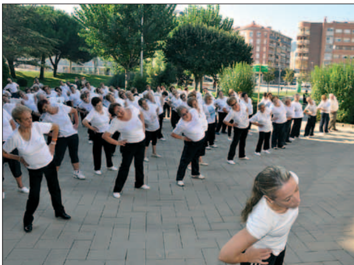
SESSIÓ DE GIMNÀSTICA ALS JARDINS DE L'AJUNTAMENT