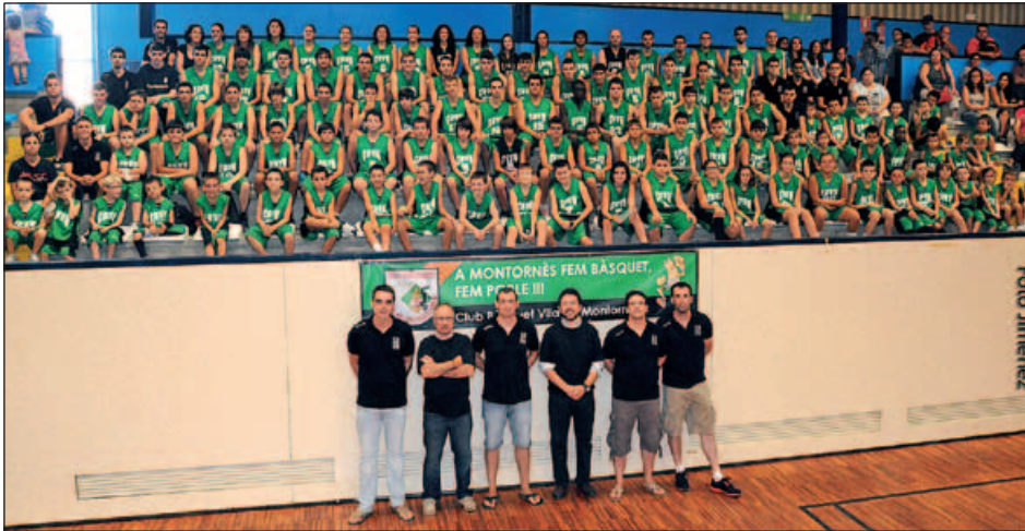
EQUIPS DEL CLUB BÀSQUET VILA MONTORNÈS

L'entitat ha encetat la temporada esportiva amb 12 equips, 170 membres i amb denominació d'origen: el 98% dels seus integrants són del poble.