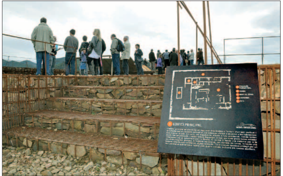
UNA DE LES DEPENDÈNCIES DEL JACIMENT

El jaciment, amb una superfície de 2.500 m 2 , conté una part residencial, patis, estances, zones de servei i dues cisternes de grans proporcions. El conjunt museístic es completa amb un punt d'informació i dues aules d'arqueologia i natura a l'entorn de l'esplanada de la font, espai central del complex. Les actuacions han comptat amb ajuts, entre d'altres, de la Unió Europea i del Ministeri de Cultura. Està previst establir un calendari de visites a