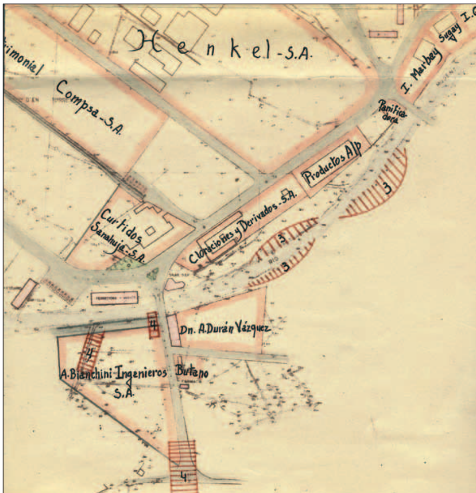
FRAGMENT DEL PLÀNOL DEL POLÍGON RIERA MARSÀ ON ES MARQUEN AMB TRAMAT VERMELL LES ZONES ON CONSTRUIR MURS DE CONTENCIÓ (NÚM. 3) I CANALITZACIONS (NÚM. 4). AMMV. S.138. GESTIÓ 1963.01.