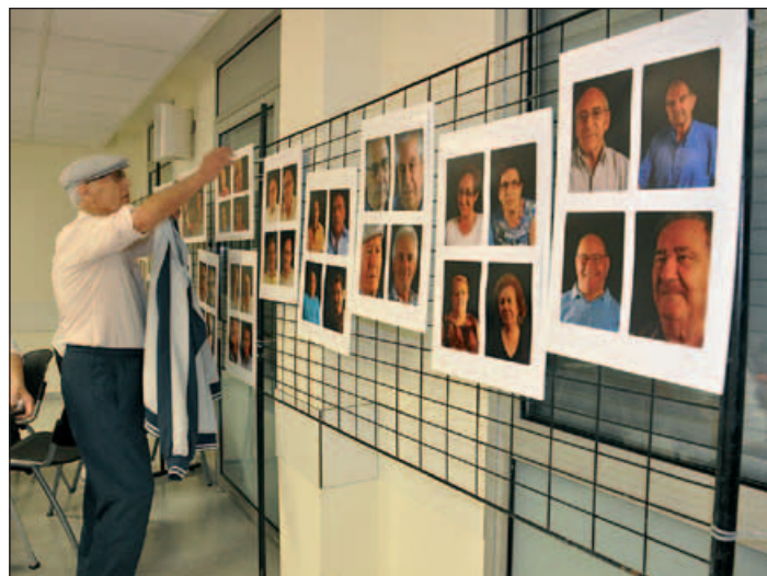
EXPOSICIÓ "ELS NOSTRES AVIS"

Més de 80 persones van participar en la sessió de gimnàstica a l'aire lliure que va cloure la setmana d'activitats celebrades a començament d'octubre amb motiu del Dia Internacional de la Gent Gran.