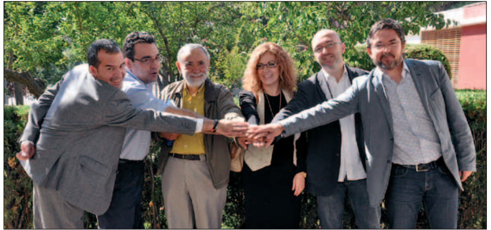
ELS SIS ALCALDES DELS MUNICIPIS QUE INTEGREN LA MANCOMUNITAT DEL GALZERAN

L'Ajuntament de Montornès s'ha incorporat en els darrers mesos a la Mancomunitat de Municipis del Galzeran, creada l'any 2008 amb la finalitat de compartir serveis, estalviar recursos i accedir als ajuts i subvencions que atorguen altres administracions com ara la Generalitat i la Diputació de Barcelona. També s'hi han sumat la Llagosta i Vilanova del Vallès. El primer projecte que compartiran els municipis serà l'aprofitament de la biomassa (restes forestals i boscoses) com a combustible per a la producció, per exemple, d'aigua calenta i calefacció. Com és sabut, Montor-